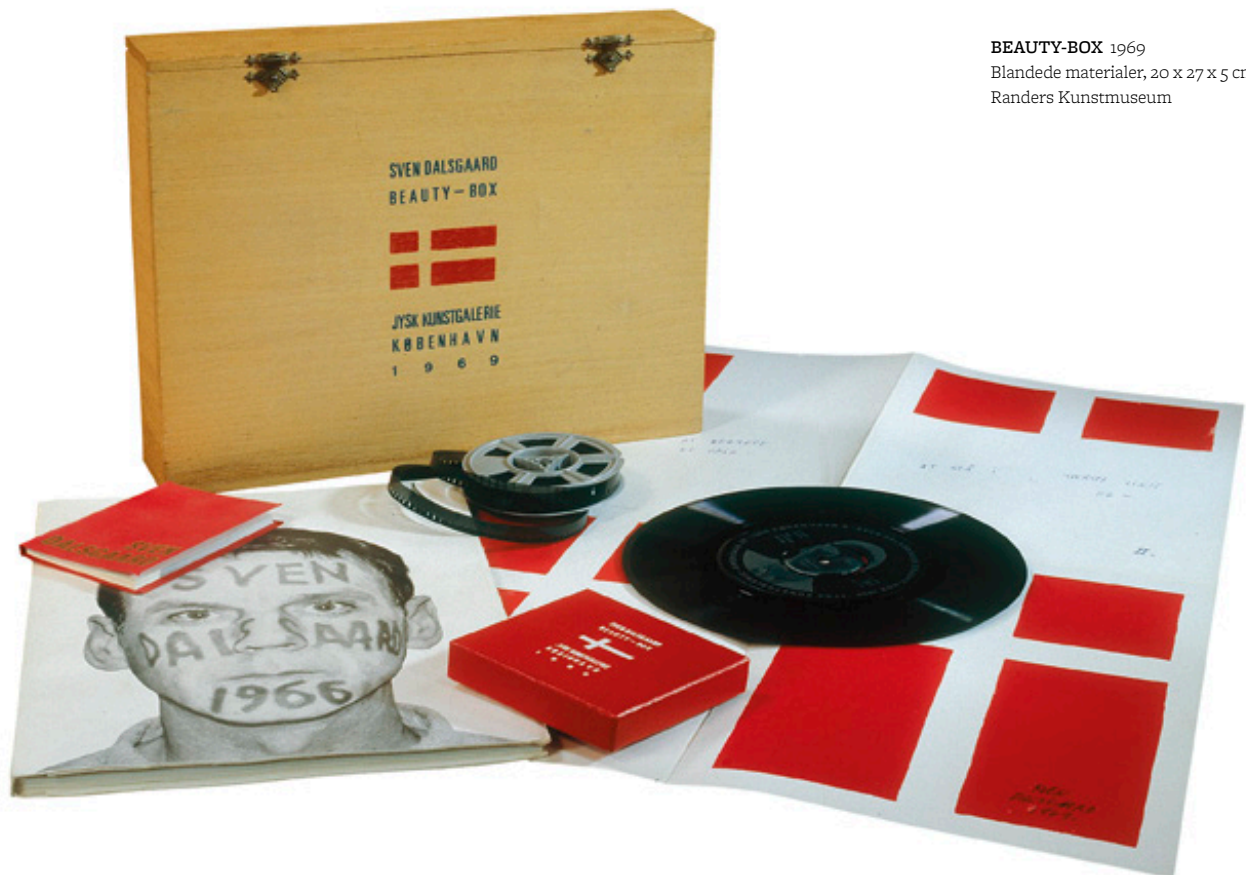
BEAUTY-BOX 1969 Blandede materialer, 20 x 27 x 5 cm Randers Kunstmuseum